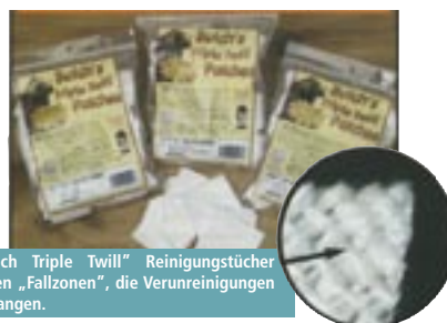
„Butch Triple Twill“ Reinigungstücher haben „Fallzonen“, die Verunreinigungen auffangen.