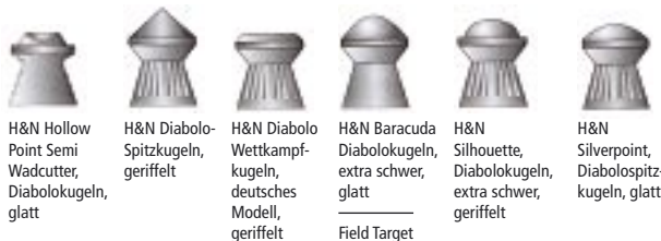
H&N Hollow Point Semi Wadcutter, Diabolokugeln, glatt H&N Diabolo-Spitzkugeln, geriffelt H&N Diabolo-Wettkampfkugeln, deutsches Modell, geriffelt H&N Baracuda Diabolokugeln, extra schwer, glatt H&N Silhouette, Diabolokugeln, extra schwer, geriffelt H&N Silverpoint, Diabolospitzkugeln, glatt