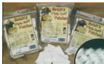
„Butch Triple Twill“ Reinigungstücher haben „Fallzonen“, die Verunreinigungen auffangen.