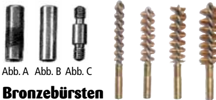
Abb. A Abb. B Abb. C