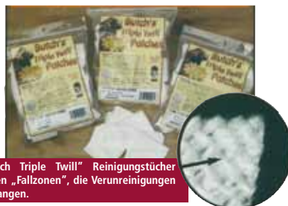
„Butch Triple Twill“ Reinigungstücher haben „Fallzonen“, die Verunreinigungen auffangen.